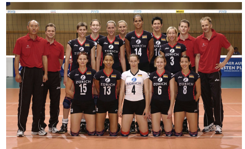
Voleibol en Francia