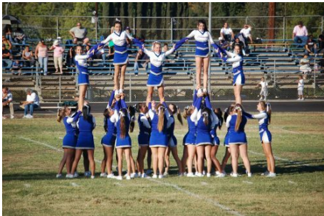
Las porristas de El camino